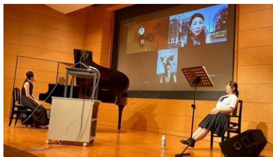
「おおがき国際音楽オンラインマスタークラス 声楽部門・器楽部門」事業（市民活動助成・SDGs 推進事業部門）