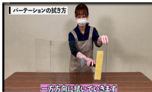
「施設の感染症対策～正しく理解しリスク軽減～」事業（市民提案事業）