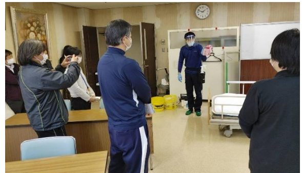
令和3年度の「市民提案事業」 「施設の感染症対策～正しく理解しリスク軽減～」事業