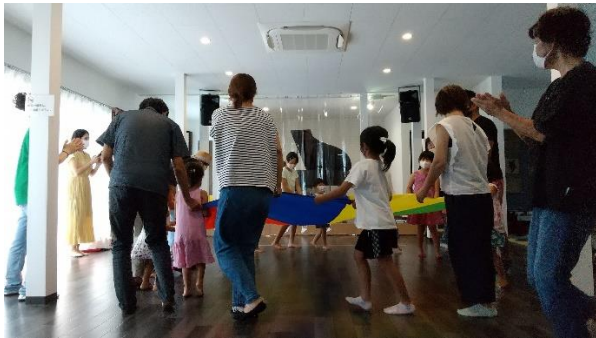
令和3年度の「初めの一步助成」 「親子で学べる音楽タイム♪」事業